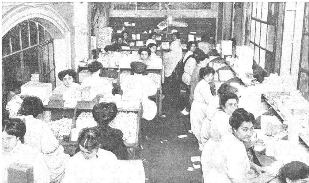
Una de nuestras salas de empaquetamiento, en las que fabricamos las acreditadas marcas «Diva Extra» y «Barrilete», de 20 y 10 centavos, respectivamente

Nuestra fábrica de cigarrillos, instalada con todo género de amplitudes, se encuentra en la actualidad en un tren de franco progreso.