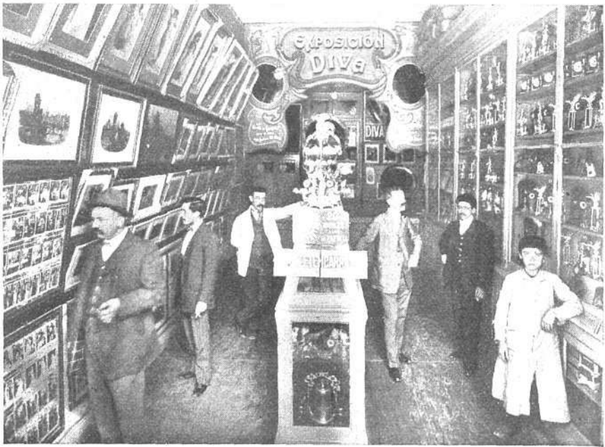
Salón de exposición

Quiere decir, pues, que finalizaron el año 1909 alcanzando muy aproximadamente la venta de sus