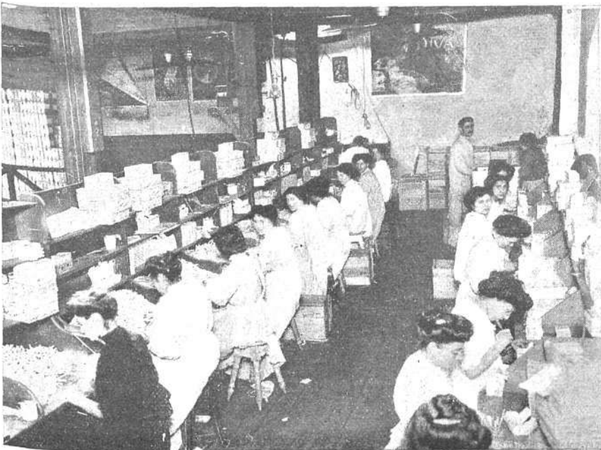
Vista de uno de los talleres

Felicitemos, pues, á los señores Rodríguez y D'Amico,